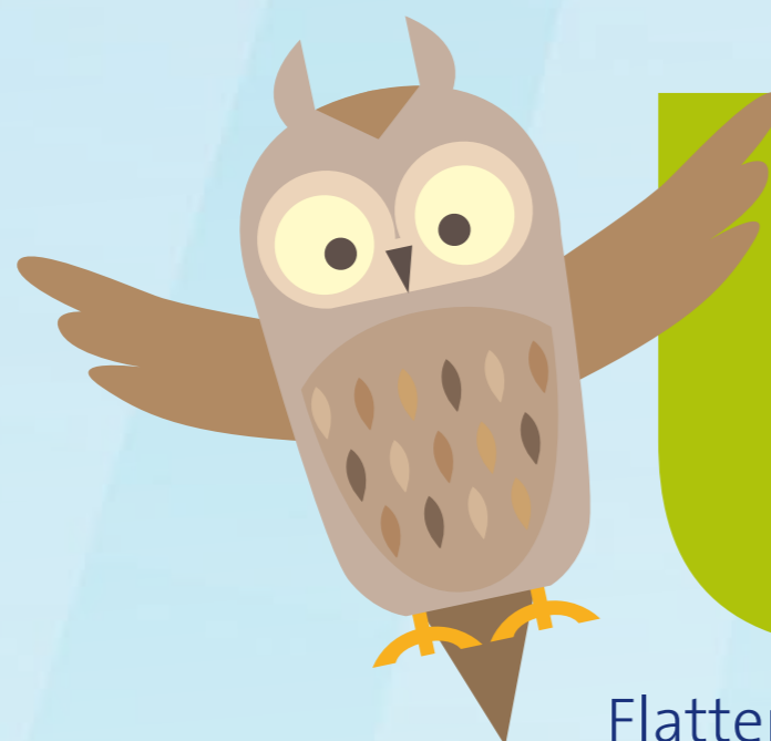
Flattern wie ein Uhu