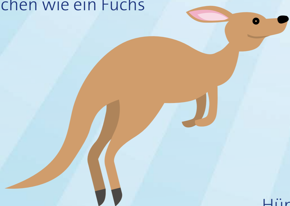
Hüpfen wie ein Känguru