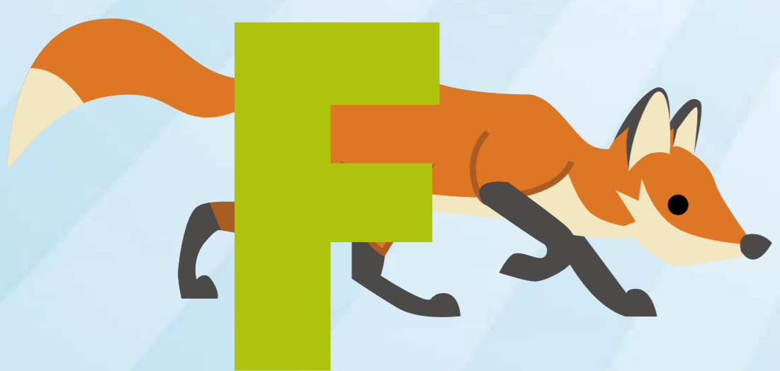
Schleichen wie ein Fuchs