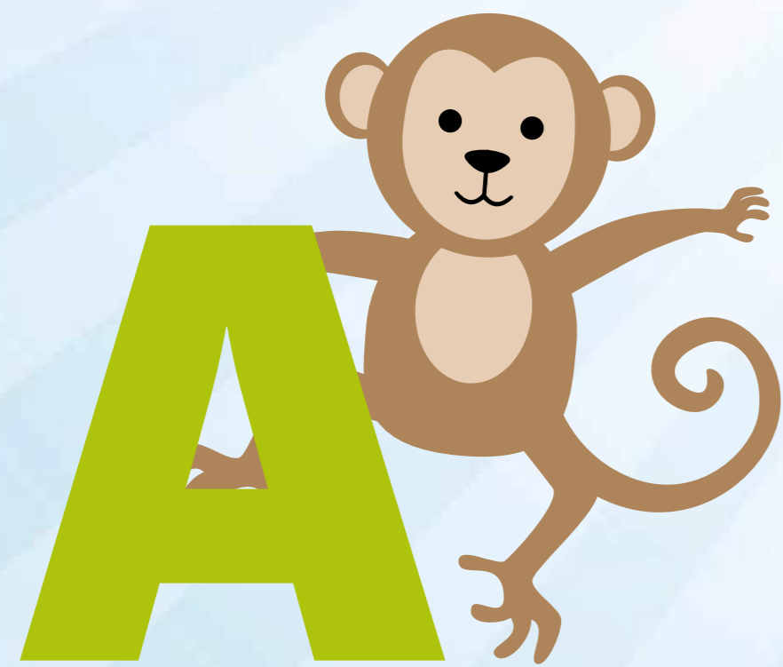
Zappeln wie ein Affe