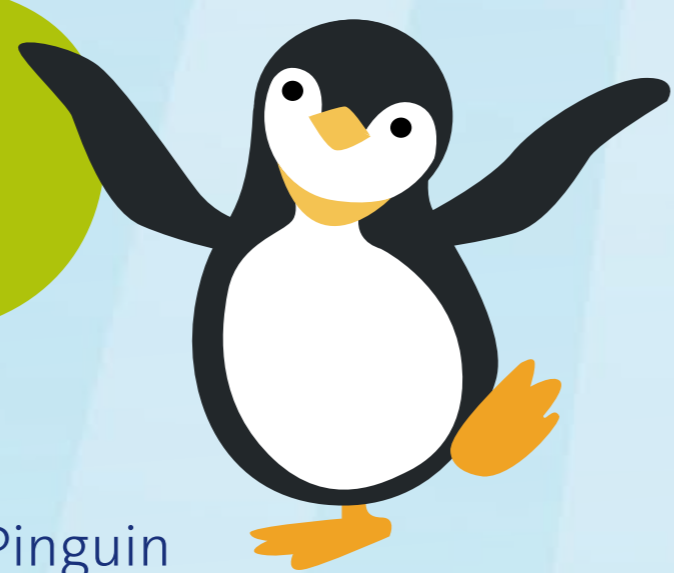
Watscheln wie ein Pinguin