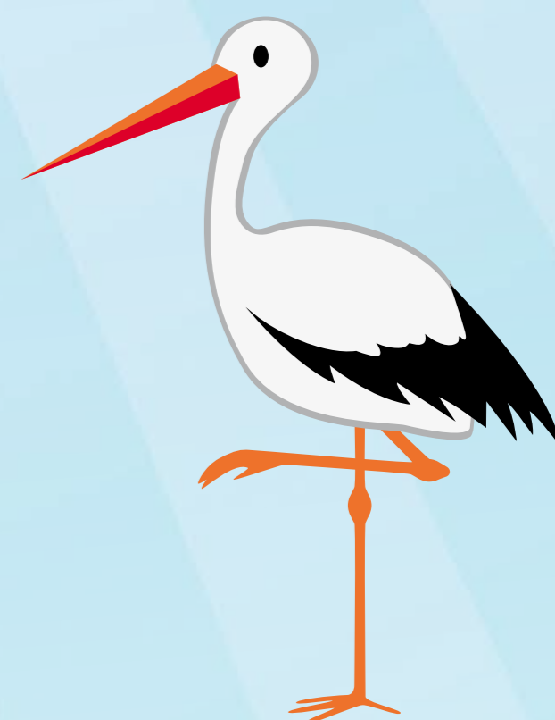
Einbeinig stehen wie ein Storch