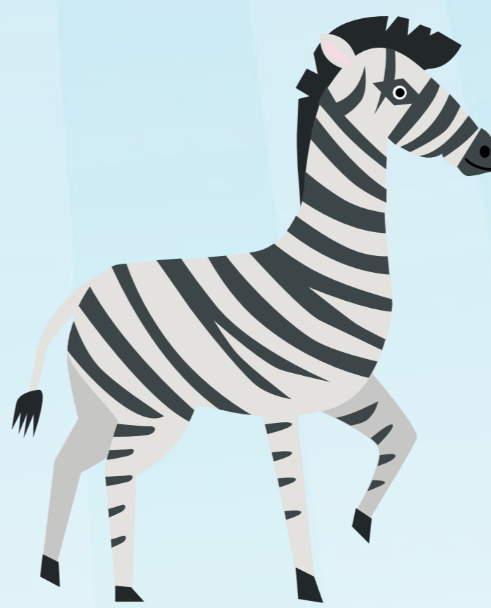
Galoppieren wie ein Zebra